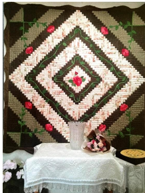
大きなキルト作品下の白いキルトも思い出の品。シルクで作り、お孫さんが生まれた時プレゼントされたそうです。

今回はご寄稿くださったものを、そのまま掲載させていただきました。お人柄がしのばれる文章と字で、懂れます！