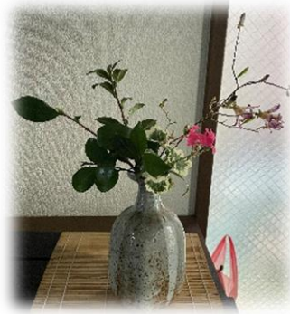
玄関に飾られたお庭のお花にもセンスが光ります。

お正月には、毎年煮豚を手作り。ご本人は持病のため脂モノは控えておられますが、離れて暮らすご家族が、毎年楽しみにされているとのこと。生け花、コーラス、ハーモニカ、俳句と多趣味で、しかもお洒落。若々しいので、ワクチン接種の際も付き添いと間違われたそう。慎重で繊細な面と、明るくおおらかな面をあわせもつ、とっても魅力的な利用者さんです！